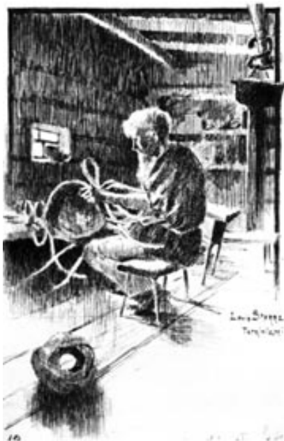
Берестяниц Налью из Харкониemi. С рис. Луиса Спарре, 1892 г.

Буквально во всем - в величине поселений и расположении дворов в них, в манере вести хозяйство, в организации внутреннего пространства изб, в количестве, качестве и назначении домашней утвари, в чистоте полов и способах приготовления пищи - во